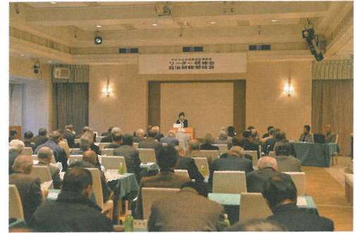
熱心に聞き入る会長たち