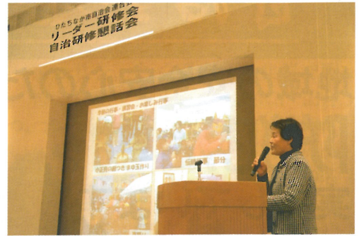
講演をして頂いた塚越理事長